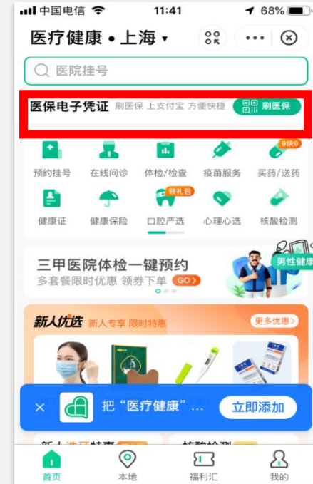
微信APP --我--服务--医疗健康 (健康云公众号)