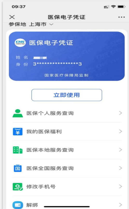
信息查询 定位开启