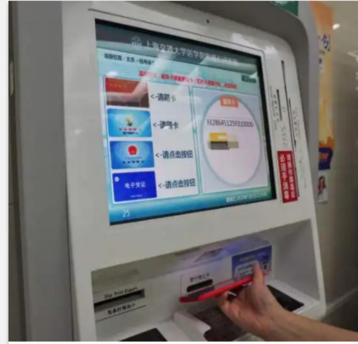
药店医院电子医保场景展示